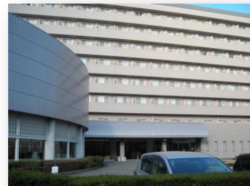
HIDA Kansai Kenshu Center (KKC) Osaka